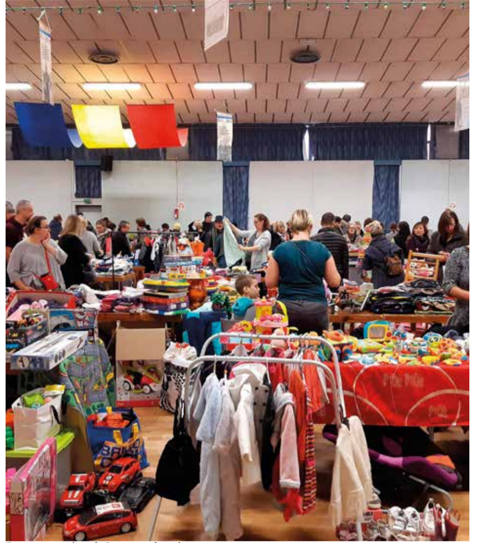
Brocante puériculture du Sou des écoles