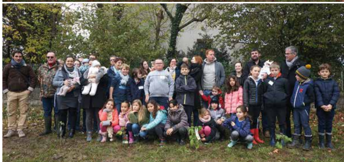
Plantations - 1 naissance, 1 arbre avec le CME et le CMJ