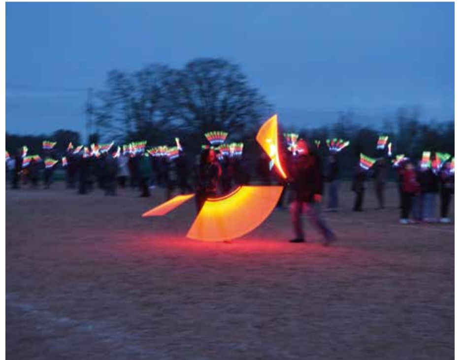
Illuminations des DionysArts