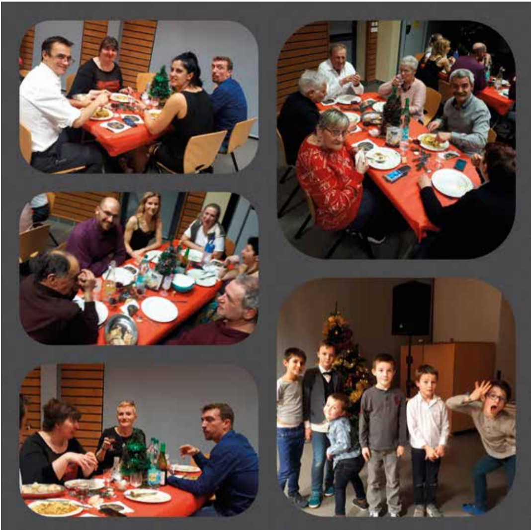
Réveillon de Noël participatif de Pôle Pyramide