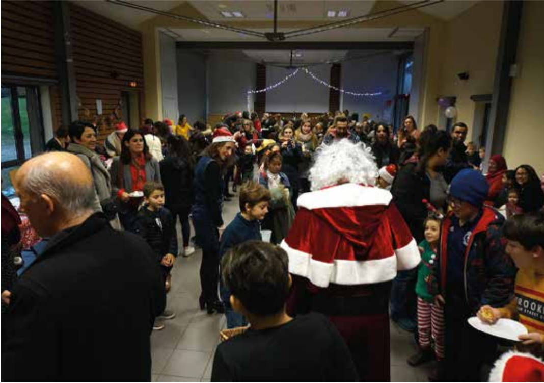
Goûté de Noël du Sou des écoles