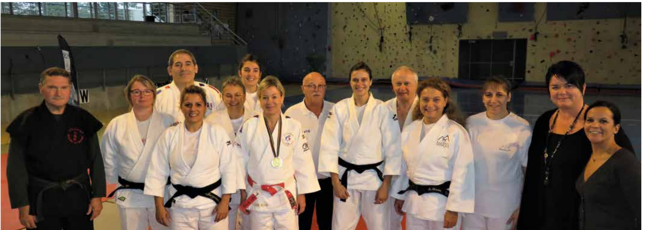
Stage de judo avec la championne olympique Cécile Nowak, réservé au femmes avec le Saint-Denis Dojo