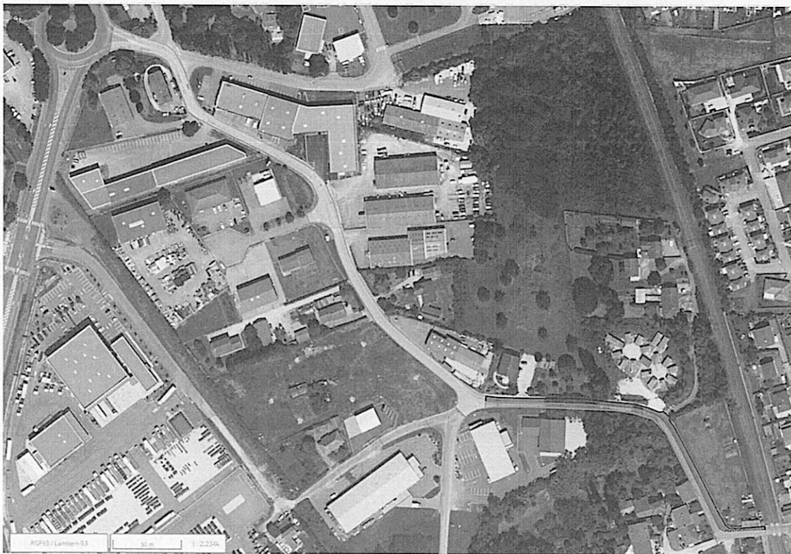
Emprise Grand Bourg Agglomération

La présente convention vise donc à définir les conditions de pilotage, de réalisation et de financement de cette opération dans le cadre de cette maîtrise d'ouvrage déléguée.