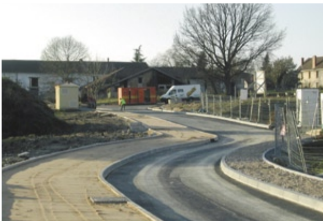
La rue Prévert rejoint la rue de Schutterwald.

Poursuivre l'aménagement et le développement de ce quartier, en lien avec celui du centre-village, constituera assurément un des points clés des années à venir pour la future équipe municipale.