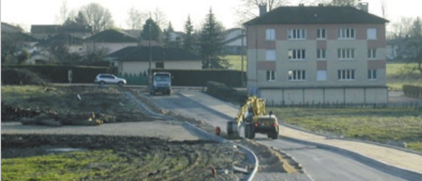
La rue de Schutterwald en travaux.

* de divers partenaires : ANAH, L'agglo, Conseil régional, Conseil général, caisses de retraite, etc.