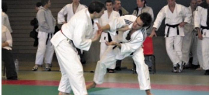
Douze judokas du club participeront à cette compétition internationale.

www.ville-saint-denis-les-bourg.fr ville.stdenislesbourg@wanadoo.fr