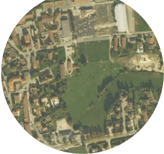
Vue aérienne du quartier de la Viole.

Perspectives 2008 Les ressources financières de la commune s'appuieront sur ses revenus propres ( locations diverses...), sur les dotations de l'État et sur la fiscalité. Cette dernière intègrera la revalorisation des bases décidée par l'État pour 1,60 %. La progression éventuelle des taux ne concernera pas les taxes foncières. Le budget assainissement intègrera une variation modérée de la taxe d'assainissement et nécessitera une mise à jour des conditions de gestion et d'entretien de la station d'épuration avec la commune de Saint-Rémy. Le budget de la régie de l'énergie sera consacré à l'achèvement des paiements de la chaufferie bois et du réseau de chaleur, et à la mise en œuvre de la gestion technique et financière des opérations de production et de revente de thermies.