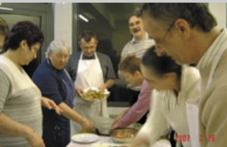
Lors d'un atelier cuisine en 2007.

Ouverts gratuitement à tous, les ateliers créatifs proposés par la commune ont repris en décembre. Objectif : préparer une journée d'animation pour 2009, autour du thème du Moyen Age. Les participants à l'atelier lecture ont choisi des textes, qu'ils travailleront avec un intervenant professionnel. L'atelier cuisine, qui se réunit une fois par mois, expérimente des recettes d'antan. Prochains rendez-vous : 28 février, 21 mars, 17 avril, 23 mai et 20 juin, de 18 h 30 à 22 h, à la salle des fêtes. Un atelier de création de décors et costumes complètera au printemps les deux précédents. Tél. 04 74 24 45 43 (bibliothèque) 04 74 24 45 50 (pôle socio-culturel)