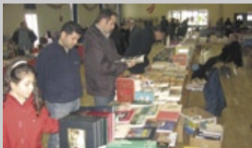
Lors du 1 er marché aux livres et disques, en janvier 2007.

Dimanche 20 avril , la salle des fêtes accueillera le 2 e marché aux livres, organisé par l'Association du livre et du disque d'occasion. Rendez-vous toute la journée. Une petite dizaine d'exposants proposeront des ouvrages et des disques, pour toutes les bourses. Le matin, le marché alimentaire se tiendra devant la salle des fêtes.