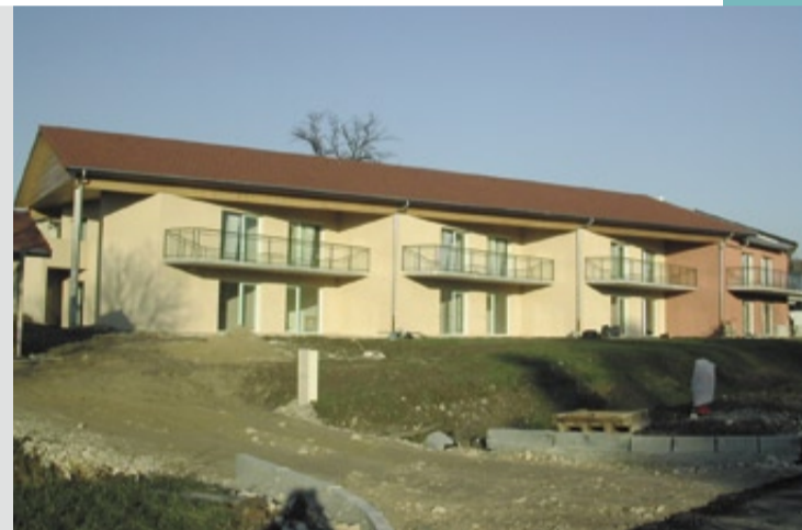
Le chantier de construction a duré quinze mois.

polyvalents et complémentaires ne manquent pas d'idées pour faire vivre le lieu et inviter les résidents à garder bon pied, bon œil et bon moral. Un « coin coiffure » sera aménagé. Des ateliers sur « la santé en mangeant après 60 ans » sont prévus, en partenariat avec le centre communal d'action sociale. Des rencontres intergénérationnelles aussi, avec le centre de loisirs. Appel a été lancé à tous les habitants de Saint-Denis, bricoleurs et artistes, pour offrir des objets faits main mêlant le décoratif et l'utile: exposés en mars lors des journées portes ouvertes, avec goûter festif réunissant les participants, ils donneront un peu d'âme aux murs neufs. Déjà un tableau du Lubéron et deux sculptures sur bois sont arrivés. À suivre. ●