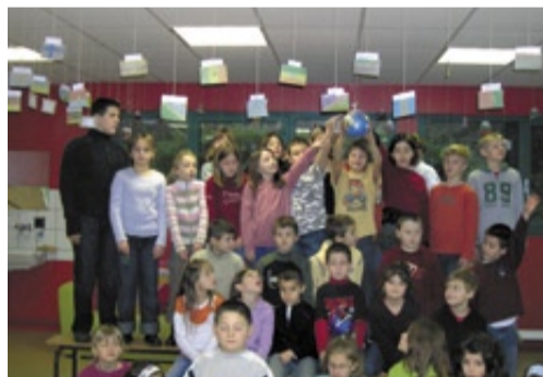
Découvrir les pays du monde.

Les cultures et les cuisines du monde sont au cœur de l'année 2008 au centre de loisirs de l'association Pyramide. Au programme des mercredis de janvier et février : des ateliers, jeux et sorties pour découvrir les arts, les traditions et les carnivals de divers pays, et des menus gourmands aux saveurs d'ailleurs. Le Carnaval sera aussi le thème des vacances, du 18 au 29 février. Deux séjours neige à Mijoux sont également proposés. ● Tél. 04 74 24 22 71 http://sataplu.zeblog.com