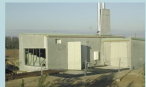
Durant les travaux.

L'ensemble chaufferie + réseau de chaleur est géré par une régie municipale autonome financièrement. Le 4 décembre, la commission d'appel d'offres a procédé au choix de l'exploitant : le marché d'exploitation de chauffage et d'eau chaude sanitaire, d'approvisionnement en bois et gaz, et de maintenance des installations a été confié à la société Dalkia France. Le contrat est établi pour une durée de 12 ans. ●