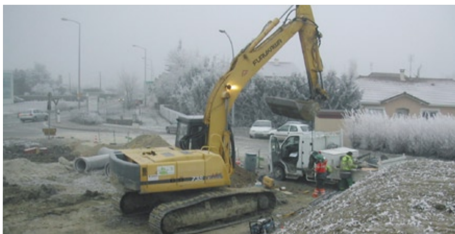
Le chantier a démarré durant l'hiver.