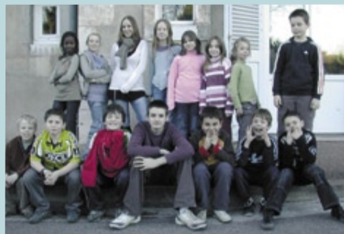
Le dialogue s'est établi tout de suite entre les enfants.

Mercredi 5 décembre, une dizaine de membres du conseil municipal d'enfants ont été accueillis par un petit groupe d'élèves de l'Institut des jeunes sourds (IJS) à Bourg-en-Bresse, pour un après-midi de rencontre conviviale. Un long et passionné échange de questions-réponses directes et sans tabou s'est établi entre les jeunes, via une traduction assurée par une éducatrice. Les jeunes conseillers ont été aussi très curieux de s'initier au langage des signes. Chacun a appris à « dire » son prénom, bonjour, au revoir et