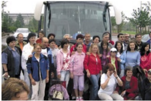
Lors de l'accueil de la délégation roumaine en août 2007.

Le comité remboursera à la commune la somme de 12 855 €, avancée par celle-ci, pour l'accueil en août 2007 d'une délégation roumaine. Compte tenu des aides de l'Union européenne, la charge résiduelle de la commune est de 5 144 €. Cet arrêté des comptes solde un séjour de qualité et de convivialité, et une action positive du comité de jumelage.