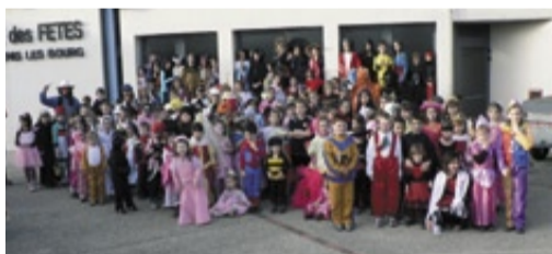
Près de 300 personnes avaient participé au Carnaval 2007.

Parents et enfants déguisés sont attendus nombreux samedi 8 mars au Carnaval 2008 organisé par l'ACS (Association culturelle et sportive), en partenariat avec le pôle socio-culturel et Pyramide. Top départ à 16 h 30 devant la salle des fêtes pour une déambulation à travers le village. Les déguisements les plus originaux seront primés. L'après-midi s'achèvera par un bal familial avec crêpes maison. Boissons et confettis seront en vente. Une réunion de préparation pour les parents aura lieu le mercredi 20 février, salle 7 (face à l'église), à 20 h. ● Tél. 04 74 24 45 50 (Olivier Molé, pôle socio-culturel)