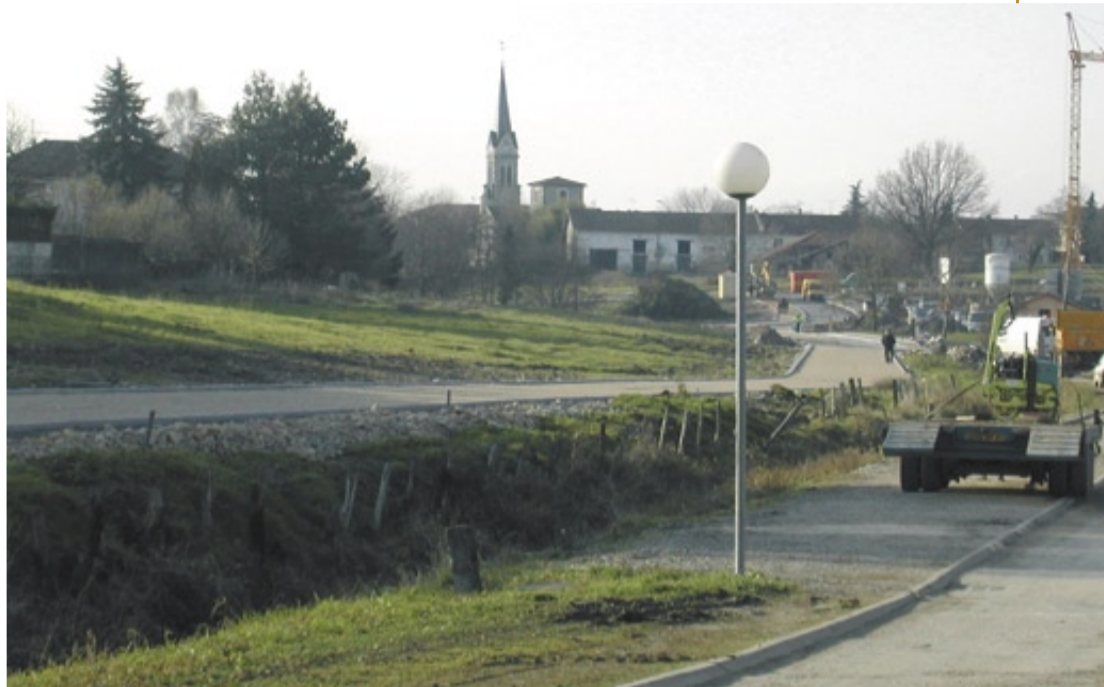
De nouveaux espaces de circulation, dont une large voie réservée aux piétons et cyclistes, desserviront le quartier.

Les modes de déplacement doux sont loin d'être oubliés : le long de la Viole, une voie piétonne et cyclable bidirectionnelle, de 4,50 m de large, est en cours de finition. Elle invite à la promenade et permet de relier aisément les abords de la laiterie-fromagerie au