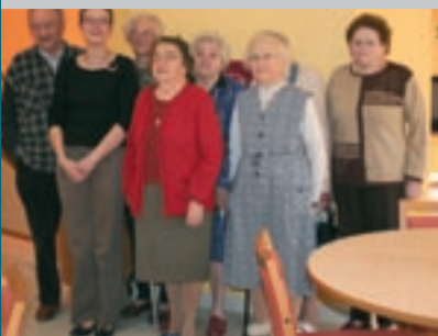
Les premiers locataires, devant la cheminée de la salle à manger.