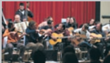
Le jazz manouche sera sur scène en mai.

L'association Accords Musique invite à deux concerts gratuits, à la salle des fêtes : ambiance Caraïbes, le dimanche 13 avril à 16 h et rencontre jazz manouche / big band le samedi 17 mai, à 20 h 30 .