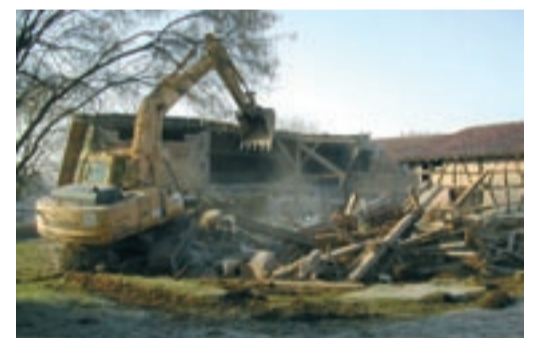
Première étape du chantier de construction du pôle socioculturel, début 2008 : la démolition de l'ancien bâtiment jouxtant la ferme Robin.

À suivre en 2008-2009 : le chantier de construction du pôle socioculturel, en face de la salle des fêtes. Les travaux de terrassement ont été réalisés par l'entreprise Fontenat en début d'année. L'entreprise Guerrier a pris le relais en mars pour les travaux de maçonnerie. Au total, le chantier devrait durer 16 mois. Pas moins de 19 entreprises y participeront.