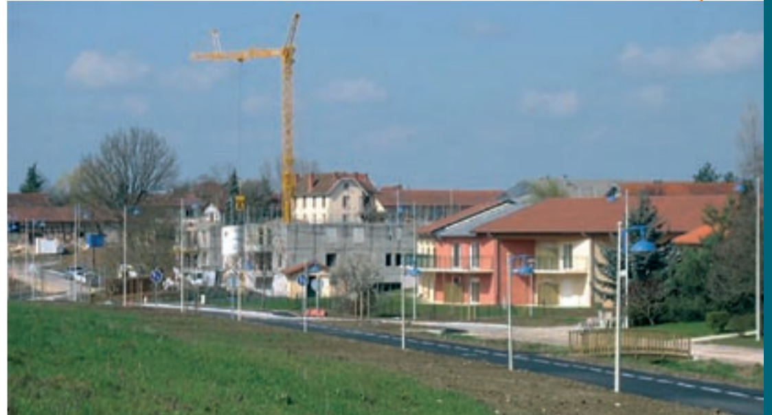
Le quartier de la Viole prend un nouveau visage.

Devenue obsolète, l'ancienne chaudière de l'église est en cours de remplacement par un nouvel équipement, plus performant à la fois en rapidité de chauffe, confort thermique et économies d'énergie. L'installation de gaines chauffantes souterraines a exigé au préalable quatre semaines de travaux de maçonnerie, effectués en mars. Le chantier est réalisé par l'entreprise spécialisée Gouilloud.