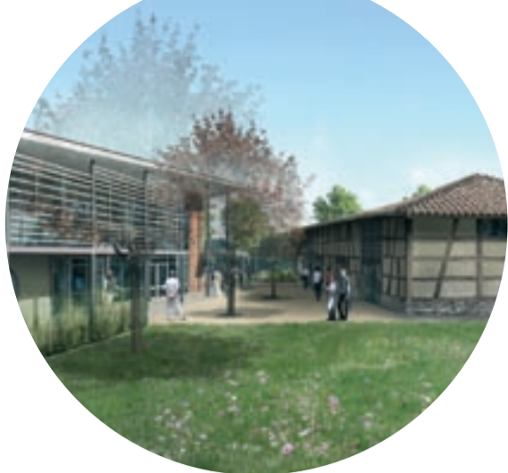
Principal investissement 2008/2009 : le futur pôle socioculturel.