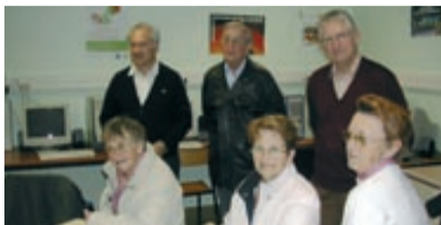
Les séances animées par des bénévoles se déroulent par petits groupes.