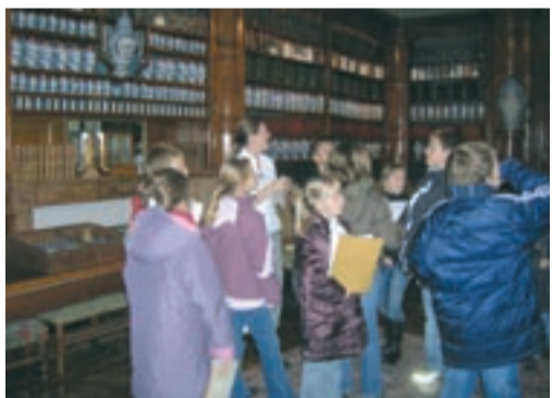
Étape de découverte du territoire local : l'apothicaire de Bourg-en-Bresse.

Au centre de loisirs Sataplu, les mercredis de mars et avril sont consacrés à la découverte du territoire local (jeu de piste, visites du théâtre de Bourg, de la gare...) et international.