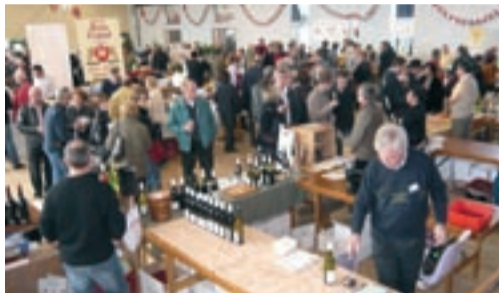
Le Salon invite à un tour de France des vignobles.

Succès grandissant pour le Salon des vins organisé fin février, par l'association de pêche Les Amis de la Veyle et le club d'œnologie Bresse Revermont : le cru 2008 a accueilli plus d'un millier de visiteurs, à la rencontre de 26 producteurs fidèles. ●