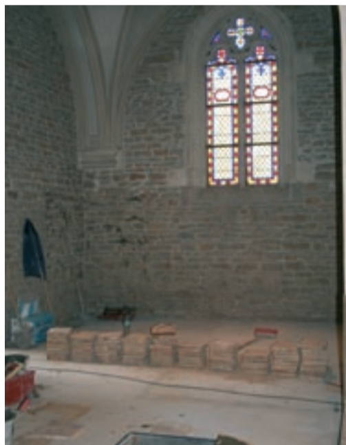
En pleins travaux

Le gros-œuvre est financé par la commune, le matériel et les frais de fonctionnement restant à la charge de la paroisse.