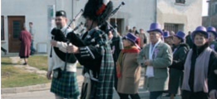
Les conscrits ont défilé joyeusement au son des cornemuses et de la fanfare de Polliat.

Samedi 14 juin , le gala sportif de l'ACS se tiendra pour la première fois en plein air, sur le terrain de football. Le spectacle se déroulera de 15 h 30 à 19 h , puis de 20 h 45 à 23 h , après le repas servi par le comité des fêtes. La soirée s'achèvera par un feu d'artifice ou « de la Saint-Jean ». En cas de pluie, repli à la salle des fêtes.