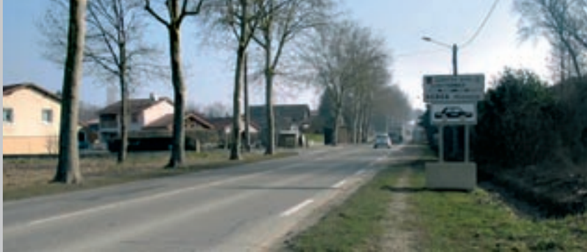
L'aménagement du CD 936 (avenue de Trévoux) commencera par l'enfouissement des réseaux.