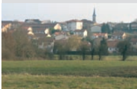
Préserver l'environnement est une volonté forte du nouveau conseil.

Au chapitre des actions nouvelles, le maire et son équipe souhaitent développer des actions environnementales. Exemple : étendre la démarche d'approche environnementale de l'urbanisme (AEU), déjà engagée pour le secteur de la Viole, à l'ensemble des projets d'aménagement.