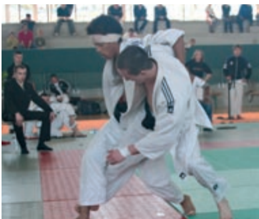
En finale juniors.

Le tournoi sera reconduit en 2009, avec d'ores et déjà la participation assurée de l'équipe nationale suisse et d'une trentaine de judokas de Martinique. ●