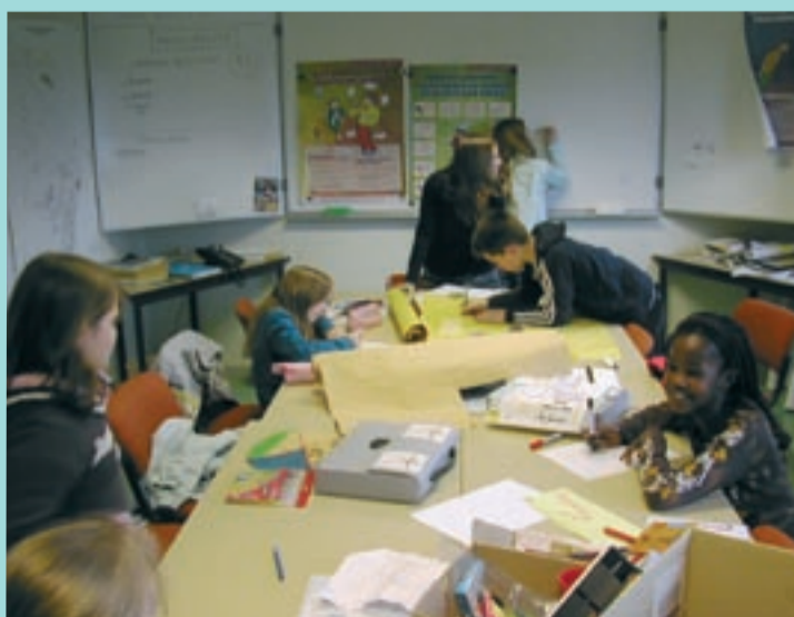
En pleine préparation d'exposition.