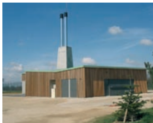
La nouvelle salle est ouverte à toutes les associations.

Devenue obsolète, l'ancienne chaudière de l'église est en cours de remplacement par un nouvel équipement, plus performant à la fois en rapidité de chauffe, confort thermique et économies d'énergie. L'installation de gaines chauffantes souterraines a exigé au préalable quatre semaines de travaux de maçonnerie, effectués en mars. Le chantier est réalisé par l'entreprise spécialisée Gouilloud.