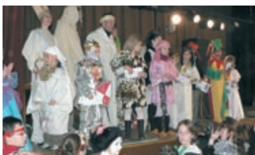
Enfants et adultes étaient déguisés.

Le 8 mars, 280 habitants ont participé au Carnaval organisé par l'ACS en partenariat avec le centre de loisirs Sataplu et le pôle socioculturel. Le défilé festif s'est achevé par un bal familial avec goûter, à la salle des fêtes. ●