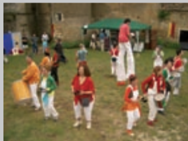
Au festival du Curieux 2006.