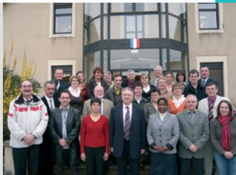
14 femmes et 13 hommes composent le nouveau conseil municipal.

Le 9 mars, près de 70 % des électeurs inscrits se sont déplacés pour élire leurs représentants. Le 16 mars, le nouveau conseil municipal a pris le relais du précédent.