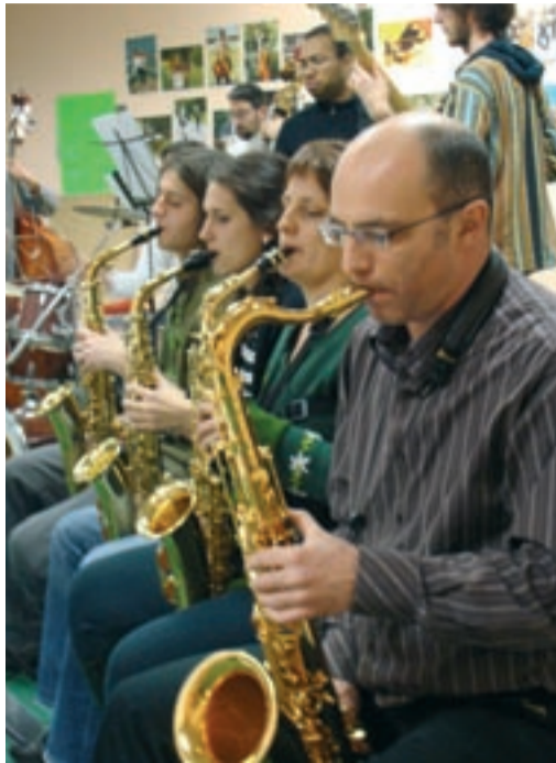
Divers orchestres et ateliers réunissent les élèves d'Accords Musique.

Nul besoin de savoir jouer pour participer aux ateliers créatifs, gratuits, proposés par la commune, avec pour objectif de créer un spectacle festif en avril 2009, sur le thème du Moyen Âge. Trois ateliers sont à l'œuvre : lecture (animée par Lysiane Martinez, metteur en scène,