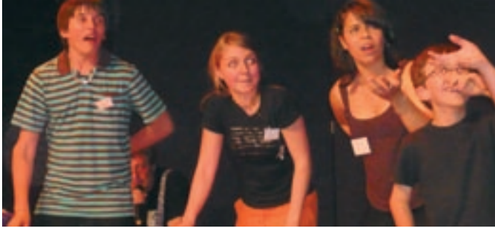
Les jeunes comédiens en scène lors du Fest'Ain des Gones.

1, place de la Mairie BP 195 - Saint-Denis-lès-Bourg 01005 Bourg-en-Bresse Cedex Tél. 04 74 24 24 64 Fax 04 74 24 35 05 www.ville-saint-denis-les-bourg.fr ville.stdenislesbourg@wanadoo.fr