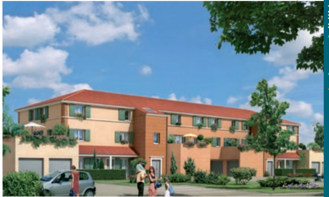
Les Allées Saint-Denis, en 2009.

parcelle ne savaient pas que leur copropriété faisait partie du lotissement ! » Le dialogue se noue vite autour des questions techniques : « On a souscrit un contrat pour l'entretien des espaces verts. On a expliqué aux nouveaux habitants où se trouve la déchetterie de Monternoz. Un lotissement est accueillant s'il reste propre. On se connaît encore peu mais on sent déjà une bonne volonté et une bonne ambiance. »