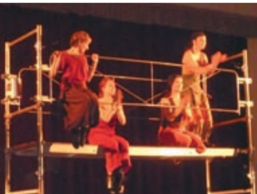
Danse, musique et chant mêlés, pour une histoire invitant au métissage des cultures.