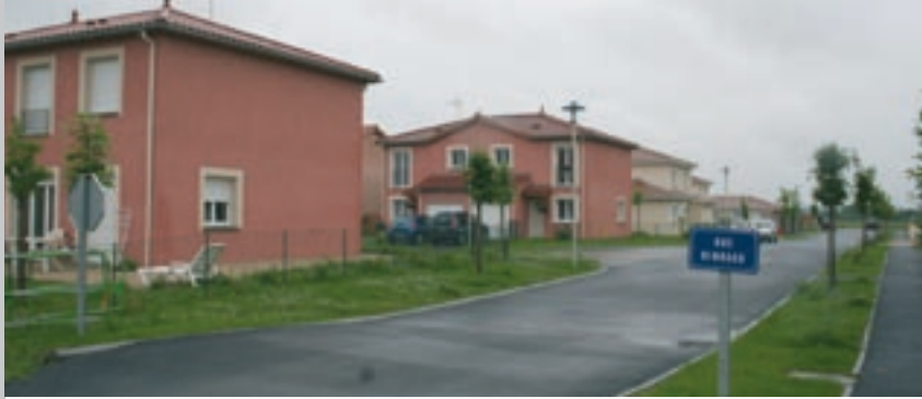
Au sud-est de Saint-Denis, les Allées Rimbaud comptent 44 logements, dont 12 locatifs.