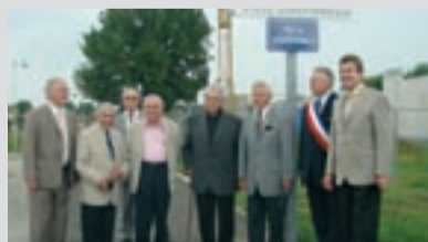
Le dimanche matin, les élus ont inauguré la rue de Schutterwald.

À noter plus particulièrement à l'affiche de cet Été sous chapiteau: un « best of » de la saison burgienne Des notes et des mots le 12 juillet, une soirée musique