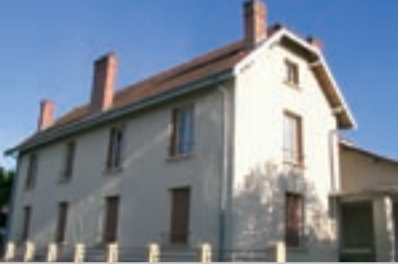
L'ancien bâtiment de l'école du Village sera démoli cet été.

La consultation des entreprises pour la déconstruction-démolition de l'ancien bâtiment de l'école élémentaire du Village est engagée. La déconstruction, avec démontage sélectif, sera réalisée pendant l'été par une entreprise d'insertion.