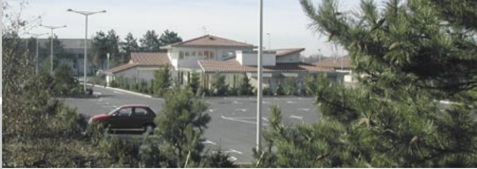
La nouvelle esplanade.