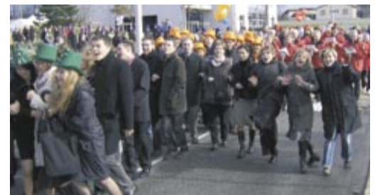
Petits et grands ont participé à la vague.

Une centaine de « classards », de 10 à 80 ans, ont joyeusement défilé dans les rues de la commune le dimanche 11 février. Organisées par les « 40 ans », les festivités se sont poursuivies par le traditionnel banquet qui a réuni près de 300 convives, à la salle des fêtes. Le lendemain, c'était au tour des jeunes conscrits de 19 ans d'inviter aux matefaims. ●