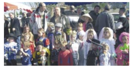
Au marché du Carnaval.

Le comité de jumelage Saint-Denis/Schutterwald prépare activement le week-end allemand des 28/29 avril. Rendez-vous le samedi, à 14 h 30, pour une rencontre sportive ACS - Schutterwald, et à 20 heures pour une soirée dansante avec choucroute. Le dimanche matin, alors que nos amis allemands visiteront la Bresse, le comité tiendra un stand au marché, avec des spécialités d'outre-Rhin. Auparavant, au cours de son assemblée générale annuelle, le comité a présenté le programme de préparation du 20 e anniversaire du jumelage qui se déroulera les 31 mai et 1 er juin à Saint-Denis et les 13/14 septembre 2008 à Schutterwald. Toutes les bonnes volontés, enfants, jeunes, adultes, sont les bienvenues. Une occasion conviviale d'apporter sa contribution à la construction de l'Europe. ●