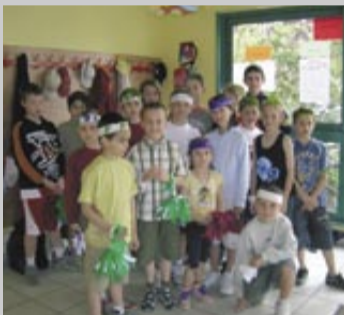
Au centre de loisirs Pyramide.

Les familles domiciliées à Saint-Denis bénéficient d'une aide pour les journées en centres de loisirs, les vacances avec hébergement, les camps et séjours linguistiques. Afin de faciliter les démarches des parents, le CCAS (Centre communal d'action sociale) a modifié le fonctionnement. Désormais, chaque famille doit fournir obligatoirement son dernier quotient familial CAF (Caisse d'allocations familiales). Celui-ci, correspondant à un code, sera transmis à l'association Pyramide, qui déduira directement le montant des aides du coût du séjour. Les autres règles d'attribution restent inchangées.