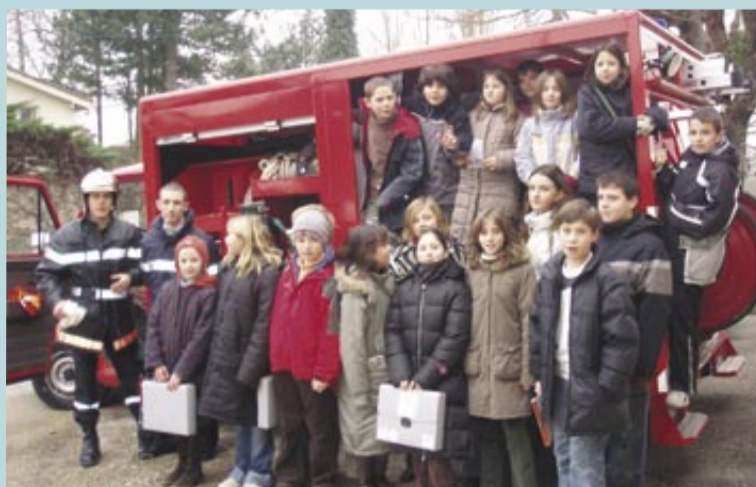
Les jeunes conseillers municipaux ont posé de nombreuses questions aux sapeurs-pompiers.

Le 31 janvier, les jeunes conseillers municipaux étaient les invités des sapeurs-pompiers du CPI (centre de première intervention) de Saint-Denis, pour une journée de visite active de la caserne et du matériel. Statut bénévole et professionnel, motivation, engagement, interventions : ils ont posé de nombreuses questions aux « soldats du feu ». Une rencontre qui déclenchera peut-être