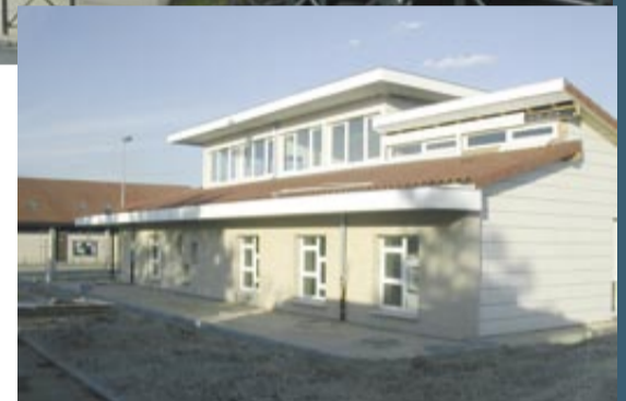
Investissement le plus lourd des dernières années : le pôle petite enfance.