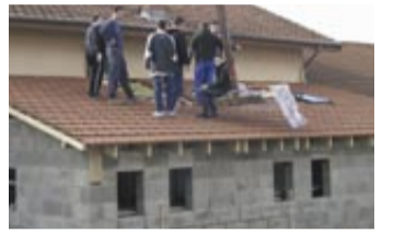
Les sapeurs-pompiers se sont relayés sur le chantier.

Le CPI (centre de première intervention) des sapeurs-pompiers volontaires de Saint-Denis manquait de vestiaires dûment aménagés. En accord avec la municipalité, l'équipe a décidé de mettre la main à la pâte afin de réaliser les travaux d'extension. Débuté en décembre, le chantier est allé bon train, grâce à la participation active de tous. Le centre sera équipé de vestiaires hommes et femmes, avec sanitaires, douches et placards. L'équipe de sapeurs-pompiers de Saint-Denis compte 26 hommes et 3 femmes, de 16 à 56 ans. ●