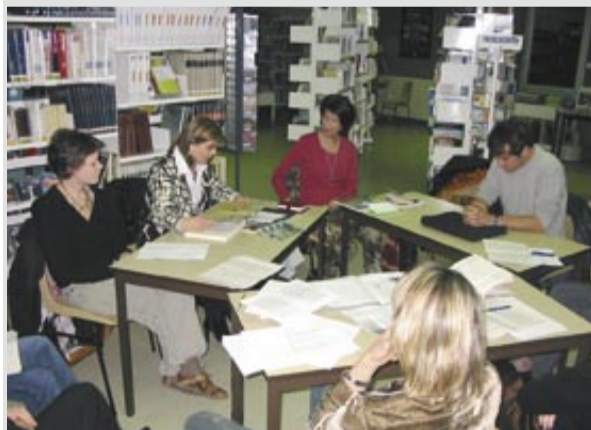
À la rencontre de textes d'ici et d'ailleurs, à l'atelier lecture.

Préparer un spectacle ensemble favorise assurément l'échange et la rencontre entre les habitants. Fédérateur d'énergies, le projet est aussi créateur de lien social.