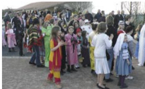
Le samedi, 120 parents et 160 enfants de 3 à 17 ans ont participé au Carnaval.

Le lendemain, la nouvelle association des Amis du marché de Saint-Denis organisait sa première animation. Là aussi, les costumes colorés étaient de la partie. ●