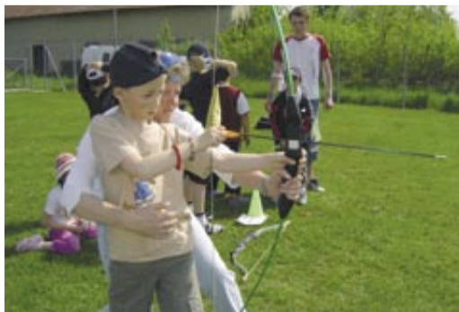
Au programme de la semaine sport : des séances d'initiation et une grande journée de mini-compétitions primées.