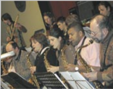
Jazz, classique et airs du monde sont au répertoire d'Accords musique.

Deux rendez-vous marquent le début d'avril : le 4 , le stage de jazz manouche s'achèvera par un concert à Montrevel ; le 7 , les musiciens participeront à la soirée café-théâtre de l'ACS. Le premier week-end de juin , la musique sera aussi de la partie au spectacle jeunes de l'ACS. Et le samedi 23 , l'association s'associera à la fête des écoles.