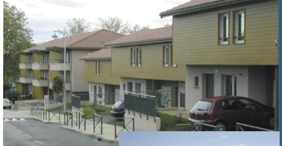
La commune soutient la construction de logements sociaux.

Bilan positif: durant ces six ans, la commune a largement investi afin de créer des équipements répondant aux besoins de la population, tout en réduisant son endettement et en maintenant des taux de fiscalité acceptables.