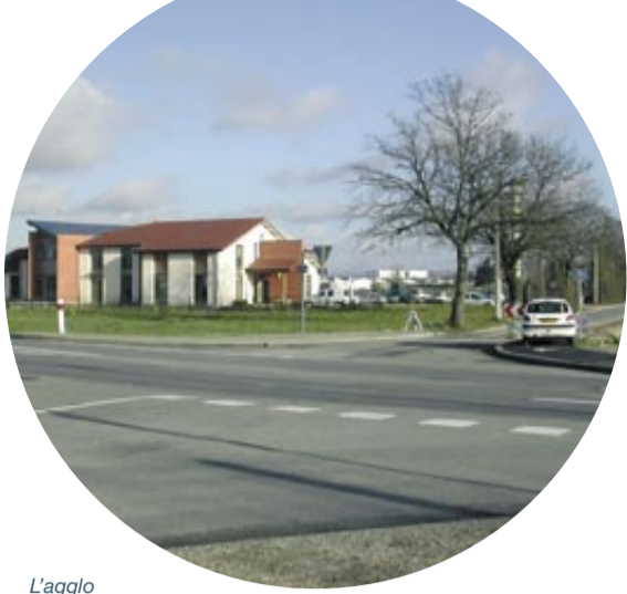
L'agglomération va aménager le rond-point de Chalandré.