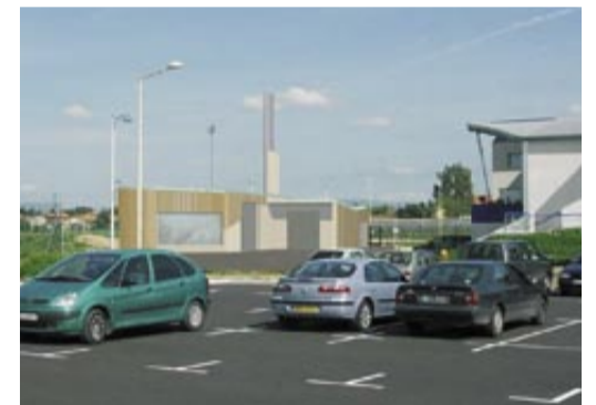
La future chaufferie bois.

Afin de gérer la construction et le fonctionnement du réseau de chaleur et de la chaufferie bois, et notamment la production et la revente des thermies, le conseil municipal a créé la Régie de l'énergie. Cette régie municipale, à seule autonomie financière, sera dotée d'un budget annexe, après avis du conseil d'exploitation. Ce dernier réunit quatre délégués du conseil municipal et deux représentants de Bourg Habitat et de la PUV La Chênevière.