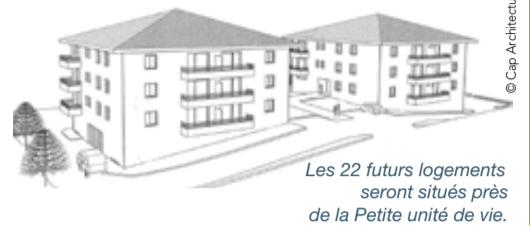
Les 22 futurs logements seront situés près de la Petite unité de vie.

La commune participera à hauteur de 3 000 € par logement à la construction par Bourg Habitat de 22 logements sociaux, soit une aide totale de 66 000 € versée au bailleur social. Une participation complémentaire de 30 000 € a été votée pour une partie du surcoût des ouvrages de rétention des eaux pluviales. Ces dépenses seront déduites des pénalités dues par la commune pour pallier le manque de logements sociaux, au titre de la loi SRU (Solidarité et renouvellement urbains).