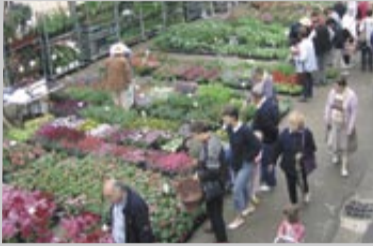
Marché aux plants 2006.

Rendez-vous annuel organisé en lien avec le comité de fleurissement, il se tiendra le dimanche 13 mai, de 8 h 30 à 12 h 30 . Une animation nature, où chacun pourra effectuer de vertes emplettes et glaner de nombreux conseils pour l'entretien des fleurs.