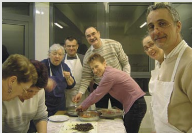
Ambiance conviviale à l'atelier cuisine.

Rouleaux de printemps, légumes farcis à l'africaine, sauce aux épices exotiques, gâteau coco... A l'atelier cuisine aussi, il s'agit d'abord de choisir les saveurs à offrir aux convives du 23 juin. Test pratique : on confectionne, on goûte, on commente.