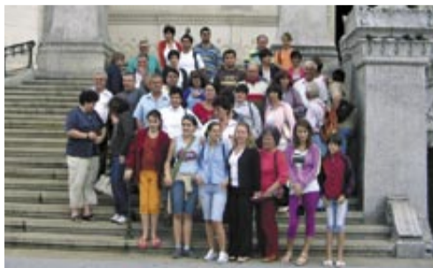
À la découverte du patrimoine régional.

Journal d'information municipal édité par la Mairie de Saint-Denis-lès-Bourg. Directrice de la publication : Denise Débias - Rédaction et mise en page : M&G Éditions/Chorégraphic (Bourg-en-Bresse) - Impression : Imprimerie de Bourgogne - Crédits photographiques : Chorégraphic, mairie de Saint-Denis, associations, Jean-Paul Thouny, Thierry Moiroux - Distribution : Ainterjob. Ce journal est imprimé sur un papier recyclé.