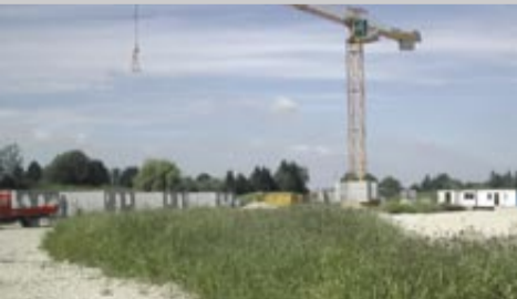
Le futur quartier des Artistes.