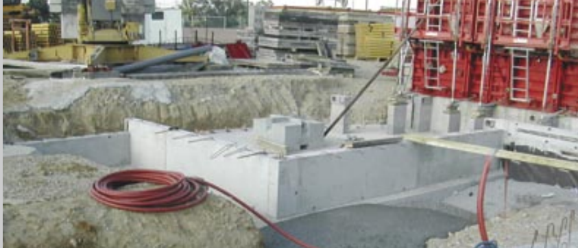
La chaufferie bois en construction.

Près de la PUV, la construction de la résidence Prévert, qui comprendra 22 logements locatifs gérés par Bourg Habitat, a démarré.