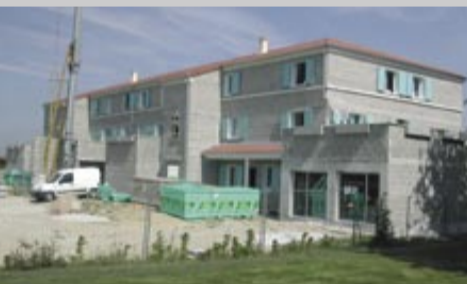
Rue des Viards, le premier immeuble devrait être prêt au printemps 2008.

Sur une superficie de 2,5 ha, un premier ensemble de 16 logements en accession à la propriété sort de terre à l'initiative d'European Home. Le programme prévoit au total 5 bâtiments, comprenant 42 logements en accession et 32 en location. Le tout entre la rue des Viards et la rue des Lazaristes.