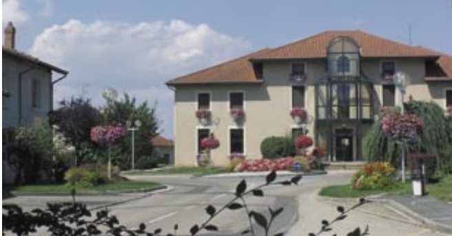
Plus de trois quarts des habitants inscrits sur les listes électorales ont voté lors des dernières élections.