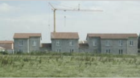
Les futures Allées Rimbaud.

Premier chantier, lancé l'hiver dernier par Logidia (ex-SA HLM) : la construction des Allées Rimbaud, petit ensemble de 12 logements locatifs dont 7 pavillons, près de la rocade. Il devrait être fin prêt au printemps prochain.