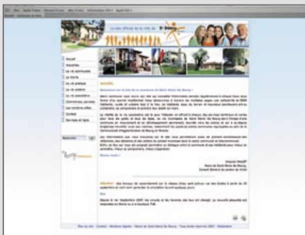
Simple à consulter, le site est à la fois sobre et dynamique.

Il peut aussi créer des liens : une des premières réactions de visiteurs est venue d'un habitant de Lille, ex-résident de Saint-Denis, qui, en découvrant le site, a exprimé son avis positif.