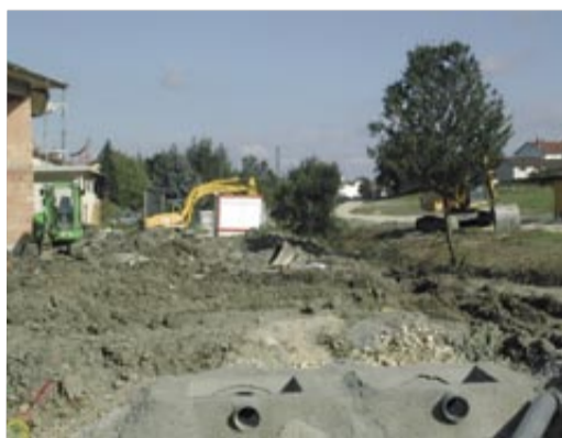
Les travaux vont bon train.

Débuté à l'automne 2006, le chantier de la PUV (petite unité de vie) La Chenevière arrive également à terme. D'une surface de 1 500 m 2 , sur un terrain de 4 500 m 2 , ce nouveau lieu de vie réservé aux personnes âgées, équipé de services adaptés (téléassistance, animation, restauration, entretien du linge...), comprendra 22 logements locatifs, dont deux T2, et des locaux communs. Ouverture prévue fin 2007. Coût total des travaux : 2,3 M€, engagés par Bourg Habitat. ●