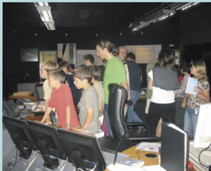
La visite de la salle de vidéosurveillance de l'A 40 a passionné petits et grands.