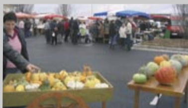
Au marché d'automne 2006.

Le marché d'automne se déroulera le dimanche 18 novembre . Au programme : expositions de cartes postales, timbres, modèles réduits, champignons, légumes extraordinaires, et soupe à la courge offerte par le conseil municipal.