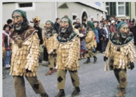
En visite au Carnaval, en Allemagne.