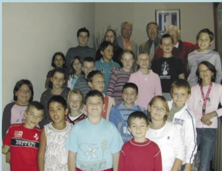
Le conseil municipal d'enfants 2007/2008 compte 24 membres, scolarisés à Saint-Denis ou Bourg-en-Bresse, dont 11 nouveaux.