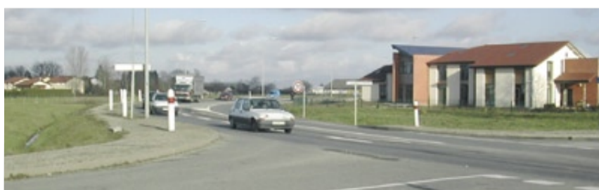
Un rond-point desservira le secteur.

Industrie : la production de biens intermédiaires représente la plus grande part (88,34 %) des 103 emplois de ce secteur qui compte 10 établissements employeurs. ●