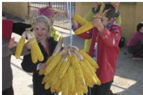
Une animation autour du maïs.