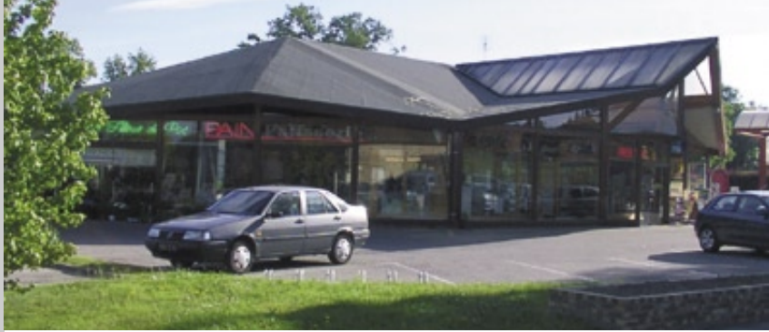
27 établissements commerciaux emploient 207 salariés, dont 64 % de femmes.