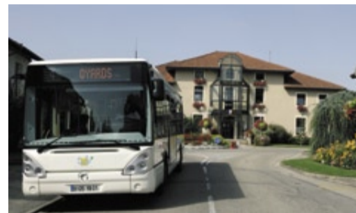
Les lignes 2 et 4 ont été modifiées.