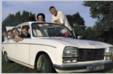
Le groupe Courant d'Eire.

Réservations à l'office de tourisme de Bourg ou au 06 82 22 42 04 .