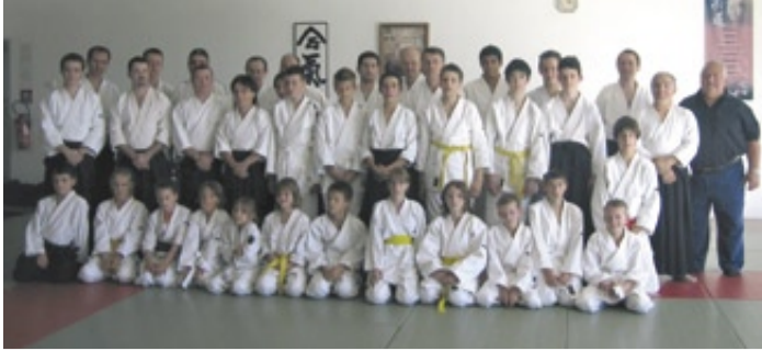
De nombreux sportifs étaient présents.

www.ville-saint-denis-les-bourg.fr ville.stdenislesbourg@wanadoo.fr