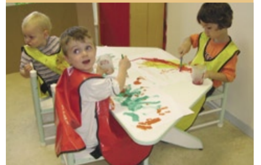
Un atelier peinture.

4 inscriptions ont été enregistrées ce jour-là. Au total, 150 familles utilisent les services du pôle: multi-accueil (36 places en crèche et halte-garderie), accueil familial (12 places) et relais assistantes maternelles. ●