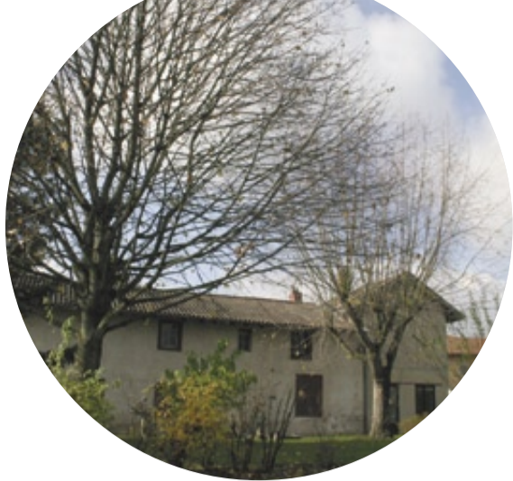
Le presbytère et le jardin de la Viole feront l'objet d'une étude de réaménagement.