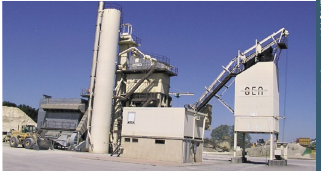
Plus d'une centaine de salariés travaillent dans l'industrie, dont 72 % d'hommes.

Tous les mardis, de 9 à 12 heures, les animateurs et les bénévoles formés du Point info emploi accueillent les personnes en recherche d'emploi, de formation, de réorientation professionnelle, afin de leur apporter aide et conseil, dans une ambiance conviviale d'échange et de rencontre. En 2006, 66 personnes ont utilisé ce service gratuit et ouvert à tous. À l'issue, près de la moitié ont trouvé un emploi ou une formation. ● 64, place de la Mairie - Tél. 04 74 24 27 85