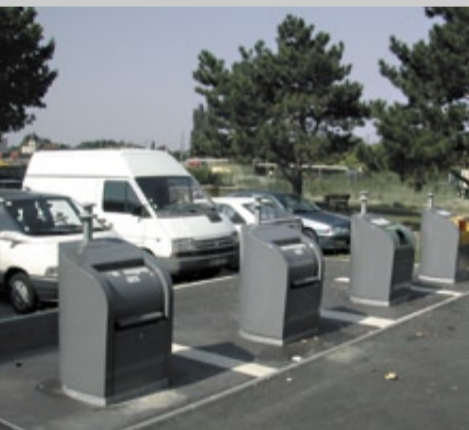
Enterrés ou aériens, 14 points de collecte sélective équipent la commune.

Du 12 au 27 septembre, une équipe d'ambassadrices du tri de L'agglo a visité plus de 1 700 foyers de Saint-Denis, pour informer les habitants du nouveau mode de collecte des ordures ménagères qui ne doivent plus contenir de déchets recyclables. À chaque foyer visité, elles ont donné un guide de tri et un sac de pré-collecte pour porter les déchets recyclables aux différents points d'apport volontaire. Depuis le 8 octobre, date du début des refus de collecte d'ordures ménagères contenant des déchets recyclables, la participation massive des habitants au tri sélectif a permis de réduire d'environ dix tonnes l'apport d'ordures ménagères à la décharge de Viriat. Ces kilos de déchets ménagers en moins sont autant de déchets recyclables qui, en empruntant la filière du recyclage, permettent de créer des emplois, d'économiser des matières premières, donc de préserver notre environnement. En octobre, les agents de collecte ont procédé à 23 refus, dont 4 concernant des professionnels. Les rippeurs avaient en effet trouvé du carton, du papier, des déchets verts, des bouteilles plastiques et en faible proportion du verre. Un numéro vert est à la disposition des habitants souhaitant avoir des renseignements concernant les déchets ou le tri : 0 800 86 10 96 .