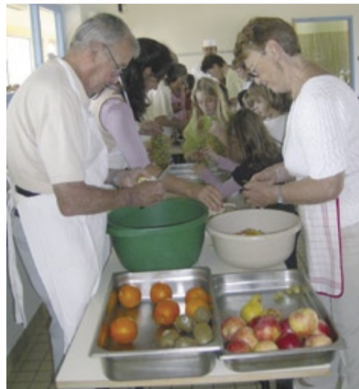
Enfants et personnes âgées ont partagé les plaisirs du goût.