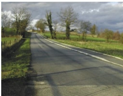
Le chemin du Cimetière va changer de nom.

Le chemin du Cimetière se transformera en rue Val de Richagnon, en référence au lieu-dit Richagnon où est implanté le cimetière au pied duquel coule le bief du même nom.