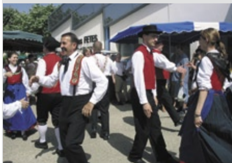
Musiques et danses traditionnelles sont souvent de la fête.

Vingt ans, c'est un bel âge, à célébrer en beauté. Les 31 mai et 1 er juin, Saint-Denis accueillera une centaine d'amis allemands. Le week-end sera placé sous le thème européen du dialogue interculturel. Sport, chants, culture, loisirs seront de la fête grâce à la participation des associations. Le samedi soir, un repas en plein air, avec viande grillée à la broche, sera animé par un orchestre folk. Les habitants sont invités à accueillir nos amis allemands et à se joindre aux festivités. Les 13/14 septembre, une délégation de Saint-Denis-lès-Bourg se rendra à Schutterwald.